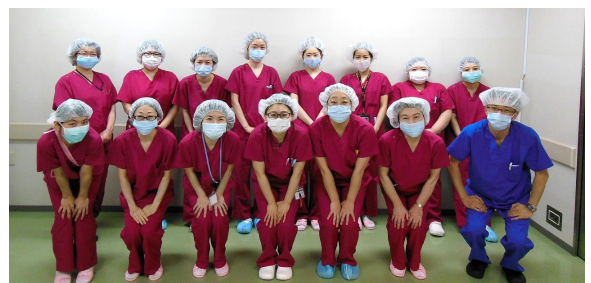
手術室看護スタッフと麻酔科医のみなさん

事前準備を大切にし、患者さまの身体への負担軽減と手術時間短縮に努めています。新型コロナウイルス感染症に対する対策なども考え、患者様とスタッフの安全を守り、質の高い医療が提供できる職場環境を目指しています。