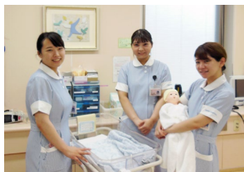
今年入職のみなさん