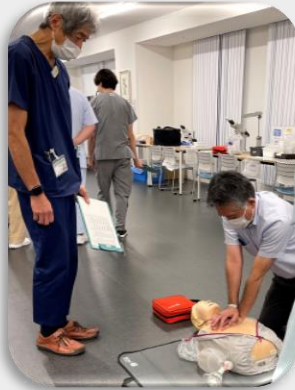
課長さんも心臓マッサージ研修