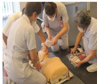
助手さんも学びます