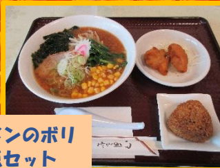
味噌ラーメンのボリューム満点セット

熱海病院地下1階にあるレストラン オーヴでは、福利厚生の一環(食のサポート)として、一般のお客様とは別に職員の席が確保されており、職員割引価格のワンコインで食べることができます。もちろんメニューも麺類、どんぶり、定食など、豊富に用意されており、元気に働く活力の源になっています。