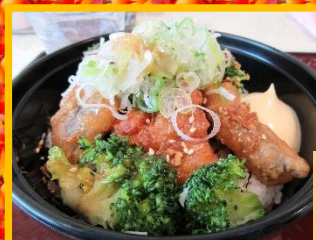
みんな大好き 唐揚げと白身魚の丼