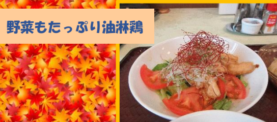
野菜もたっぷり油淋鶏